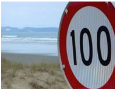
Als je de snelheidslimiet aan je laars lapt, kun je zelfs hier een boete krijgen.