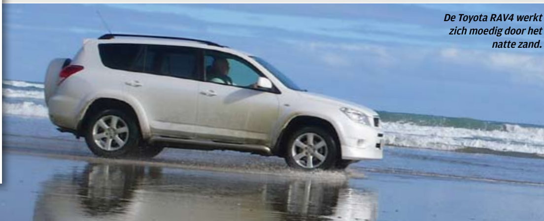
De Toyota RAV4 werkt zich moedig door het natte zand.