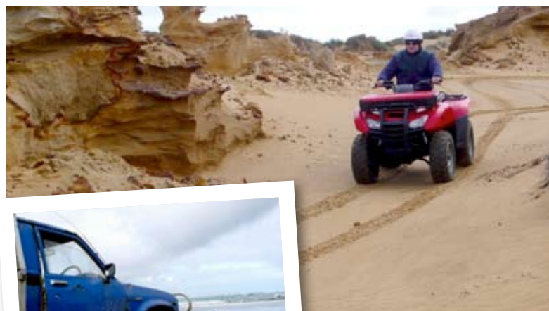
Ook op de quad is deze gigantische zandbak een waar feest.

Aan het begin van het strand is er maar één teken dat erop wijst dat het hier om een weg gaat, namelijk een verkeersbord. Op